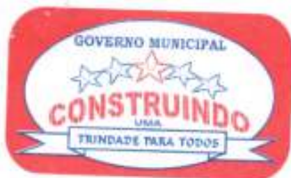
TABELA - ANEXO I